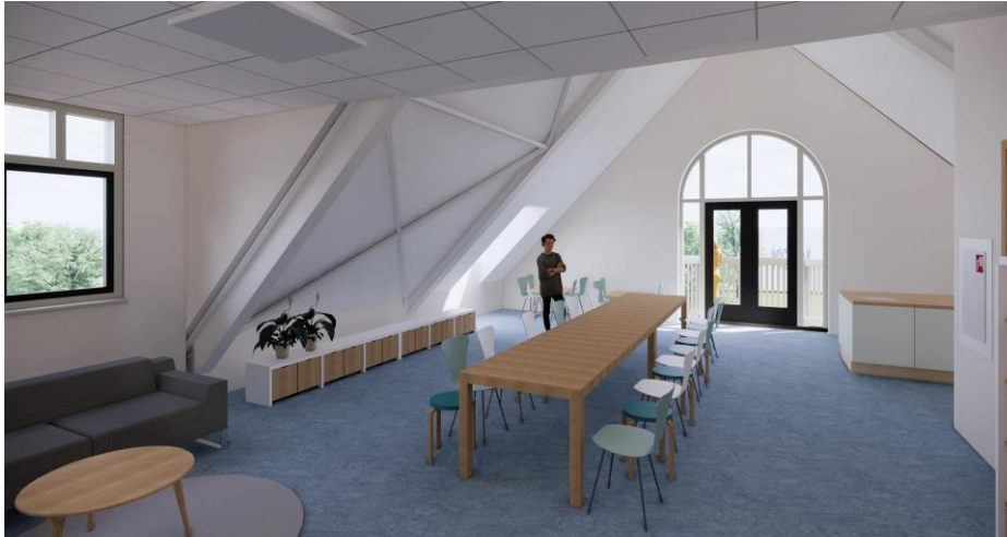
Kookgebied voor de kinderen en lerarenkamer bovenste etage