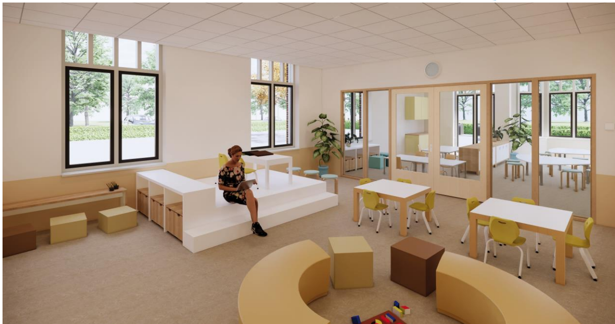
Onderste verdieping groepen 1 t/m 3